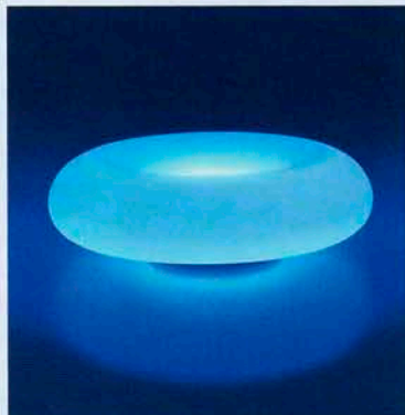
Das LEONARDO-Highlight hypnotise LED. Die extrem flache Ufo-Form und der doppelte LED-Kranz erzeugen fast schwebende Lichteffekte.

LED-Leuchten sind mehr als Lampen, so lautet die Leitlinie von LEONARDO, wobei Farbe triumphiert. In diesem Sinne entwickelte das Unternehmen eine neue Generation: ansprechend im Design und ausgeklügelt in der Technik. In der aktuellen Kollektion kamen zu den satinierten Glaskörpern Modelle aus geschliffenem Opalglas, Schaumglas mit Lufteinschlüssen und Klarglas hinzu, die sich in Gestalt einer Vase, eines Kerzenhalters, Zylinders und eines flachen Ufos vorstellen, wobei mittels eines Kontrollsystems sich die jeweils gewünschten Lichtstimmungen einstellen lassen.