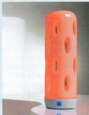
Brillante Lichtkunst: cutLED von LEONARDO. Geschliffenes Opalglas bündelt die Optik und streut die Farbe.