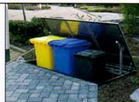
Freie Sicht ohne Mülltonnen

Umweltbewusst leben bedeutet, seinen Müll zu trennen. Die bunten Mülltonnen neben der Haustür, im Vorgarten oder in der Garage stören jedoch die Optik und rauben kostbaren Platz. Die Lösung heißt Suterra. Suterra versenkt die Mülltonnen einfach per Knopfdruck im Boden. Das spart Platz und erhält die Schönheit des Hauses. Suterra verhindert außerdem Fremdbefüllung und schützt vor Vandalismus und Diebstahl. Durch die intelligente Steuerung können die Mülltonnen in jeder beliebigen Höhe angehalten werden. So unterstützt Suterra besonders ältere Menschen und Menschen mit Handycaps. Suterra wird als geprüfte und fertig montierte Einheit geliefert. Suterra ist für zwei, drei und vier Mülltonnen mit maximal 240 Liter Füllvolumen lieferbar. Eine Anlage für 1.100-Liter-Container wird voraussichtlich ab Herbst 2007 lieferbar sein.